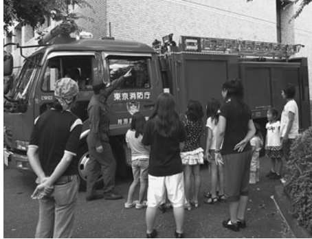
防災体験：消防車見学より