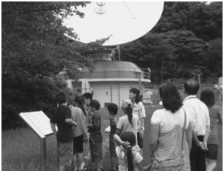
地球観測センターの見学