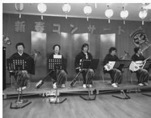
〈写真は昨年の新春コンサートより〉