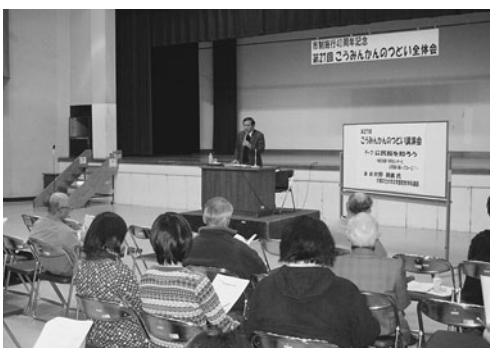
昨年の公民館のつどい(全体会)

報告会 各分科会の報告と質疑応答 ※保育(2時間、定員16名、第一分科会を除く、抽選)・手話通訳がご利用できます。希望される方は、3/8(木)までにお申し込みください。