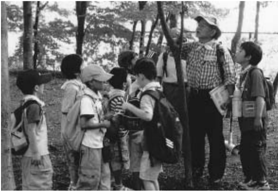
前回の「昆虫を探そう」

日にち 9/17(土) 時間 午前10時～正午 場所 南街公民館 指導者 地域の方々 定員 24名(小学生以上の児童) 申込み 9/2(金)から南街公民館