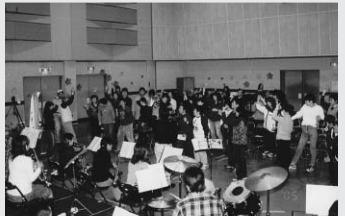
昨年度の「ひとやすみ会」