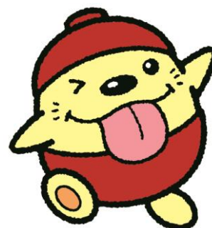
東大和市観光キャラクターうまべえ