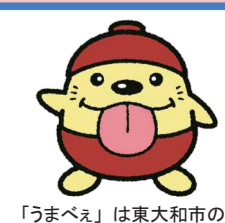
「うまべえ」は東大和市の観光キャラクターです。