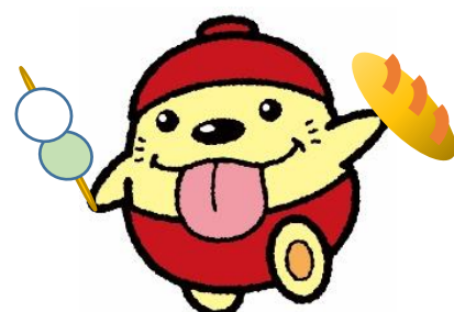
東大和市観光キャラクター うまべえ

東大和市 市民部 産業振興課 東大和市中心 3 丁目 930 番地(1階3番窓口) 電話番号 042-563-2111 内線 1076 FAX 042-563-5927