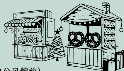
中庭 (中央公民館前)