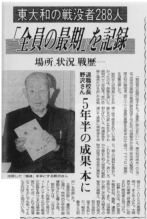
東大和市の戦没者の記録『鎮魂』を出版した際の新聞記事