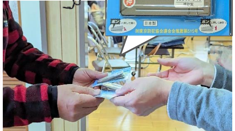
参加者に「サッシ引き戸用補助錠」を配布しました

親族を名乗っていても 還付金があるとされても あやしい電話は切る ATMにはいかない