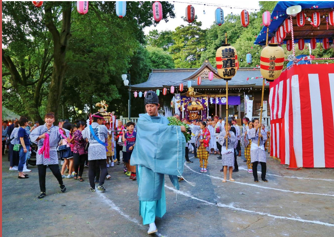
第8回東大和市まちフォトコンテスト（平成31年度実施） 最優秀作品「宮出し」