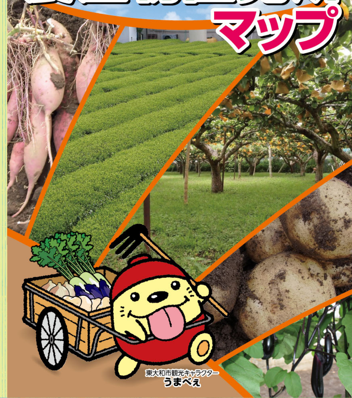
東大和市観光キャラクター うまべえ