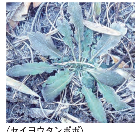
〈セイヨウタンポポ〉 問合せ 郷土博物館 ☎042-567-4800

わがまちの風物詩 〈304〉 春を待つ草 冷たい風が吹き抜けます。思わすしやがみ込むと、少しは寒さがしのげます。 同じように、背を低くして冬を越す草があります。例えば、タンポポ。地面に葉をびったりと貼り付けています。よく見ると、葉は互いに重ならないよう放射状に出ています。 これなら、風をやり過ぎませすし、それぞれの葉に光が当たると良いでしょう。春になってから芽生える草よりも、早く成長するのに有利です。 ナズナやハハコグサ、マツヨイグサの仲間など、同じ方法で春を待つ草は他にもたくさん。冬を越す草の知恵と工夫に気付いたら、寒さも少し紛れるかもしれません。