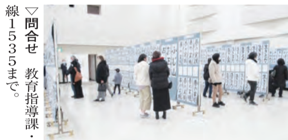
▲第41回小・中学校連合書き初め展の様子

市内の小・中学生、高校生及び友好都市である喜多方市の小・中学生の硬筆・毛筆作品、約1200点を展示します。 児童・生徒の力作を、ご覧ください。 ▽日時 1月20日(土)・21日(日)午前10時～午後4時30分 ▽場所 中央公民館ホール