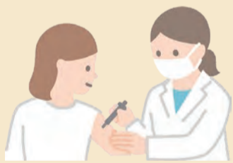
公益社団法人東大和市医師会

現在はHPVワクチンの情報をコンパクトにまとめた小冊子が作られていますので、かかりつけの医療機関等へ問い合わせてください。