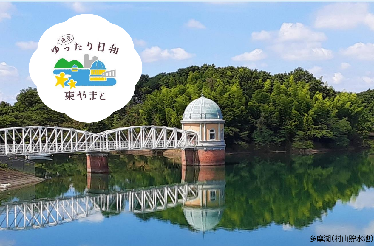
多摩湖(村山貯水池)