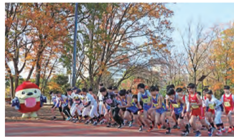
▲令和4年度のロードレース大会の様子

▽定員 500人程度(申込順) ▽参加費 ●一般・1000円 ●中学生以下・300円 ▽開催要項の配布場所 生涯学習課(市役所5階)、東大和市ロンドンみんなの体育館、各市民センター・公民館にて配布 ※市のホームページでも入手できます。 ▽申込方法 次のいずれかの方法で申込み ●10月13日(金)までに、専用の郵便振込用紙に必要事項を記入し、参加費を振込み