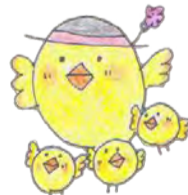
▲かるがも かもちゃん

東大和市でも見ることができる野鳥「かるがも」は、ひな育ての様子がニュース等でも報じられるなど、「子育て」のイメージとともに、親しまれています。市民の皆さんに、子ども家庭支援センターをより知っていただき、利用してもらうために、愛称として使用しています。