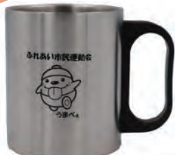
▲うまべえステンレス二重マグカップ