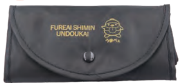
▲うまべえエコバッグ