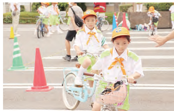
▲自転車の正しい乗り方を学ぶ子どもたち

7月9日に市役所で、東大和・武蔵村山交通少年団による交通安全教室が行われました。子どもたちは、発車するときの確認事項やハンドサイン等、自転車の正しい乗り方や交通標識について学びました。参加した子どもたちは、「自転車で曲がる時や止まる時のハンドサインが難しかった」「いろんな標識を学ぶことができたので、これからも知っていききたいと思った」等の感想があり、交通安全の意識を高めることができました。