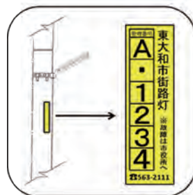
▲街路灯のシール貼付位置