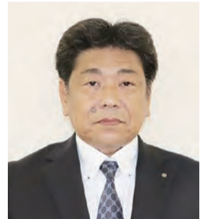
部長を歴任しました。