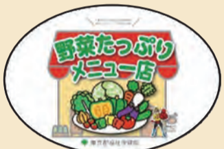
▲東京都野菜メニュー店に掲示しているステッカー

外食の際は、野菜をしっかり食べることができる野菜メニュー店を利用してみたいはいかがでしょうか。詳しくは、市のホームページ（下の二次元コードからアクセス可）をご覧ください。