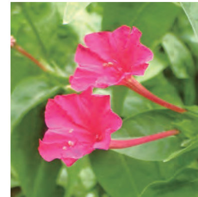
〈オシロイバナ〉 問合せ 郷土博物館 ☎042-567-4800

「フォー・オクロック・フラワー」と呼ばれる花があります。それはオシロイバナ。夕方4時に、咲くからそうです。でも、本当に4時に咲くのでしょうか? 少し早く咲いて入り、オクロックだったり、のんびりファイブ・オクロックだったりしないでしょうか? そこで、何時に咲くか観察してみました。ちょうど博物館の敷地に、オシロイバナが生えています。ある日のこと、3時半過ぎからときどき様子を見にしてみました。すると、3時59分開花! これはもう、ほぼ4時といつてもいいでしょう。フォー・オクロック・フラワーは本当でした。