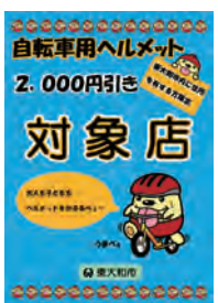
▲目印となるポスター

②本人確認書類(運転免許証・保険証・マイナンバーカード等)を提示 ③自転車用ヘルメットを通常の販売価格から2,000円割引された価格で購入