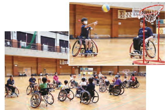
▲パス交換やシュートの練習をする子どもたち