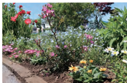
▲立野中央公園の花壇

ボランティアの協力のもと、市内23か所の公園・駅前広場等の花壇の花の植え替えを実施しました。 市民の皆さんも夏に向けてきれいな花の成長を楽しみにお待ちください。 また、公園等の花壇の花植え・管理等は、ボランティアによって行っています。