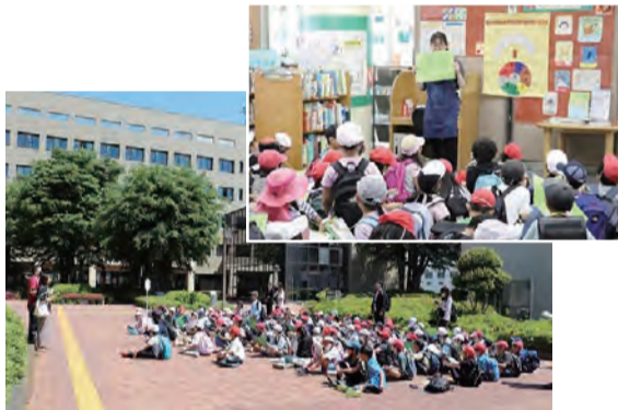
▲市役所及び図書館を見学する第十小学校の3年生