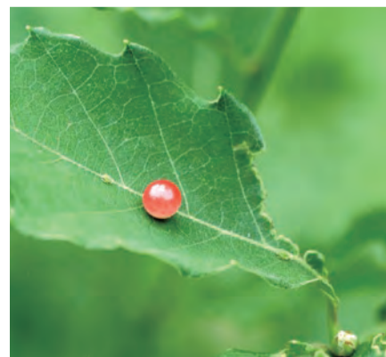
〈クヌギハマルタマフシ〉