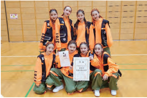
▲優秀賞を受賞した都立東大和高校のダンス部員