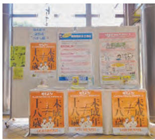
▲消費者月間パネル展の様子

国では、毎年5月を「消費者月間」とし、消費者、事業者、行政が一体となって、消費者が主役となる社会の実現について、ともに考える期間としています。 市では、この消費者月間に合わせてパネル展を実施します。 ▽日時 5月9日（火）～31日