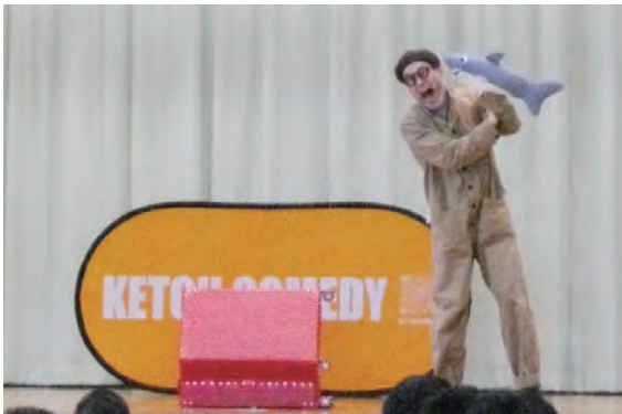
▲ケッチさんのコメディショー&パントマイム教室