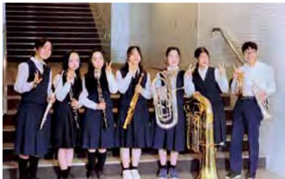
▲第四中学校吹奏楽部の出場者