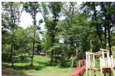
▲狭山緑地フィールドアスレチック

また、公園の整備につきましては、より多くの方々に親しまれる拠点を目指し、狭山緑地フィールドアスレチックに、都内最長、全国でも有数の規模となるローラーズライダーの設置に向けた取組を進めてまいります。 次に、生活環境、地球環境についてであります。地球温暖化対策につきましては、「第四次地球温暖化対策実行計画」に基づき、公共施設の空調設備の省エネルギー化及び照明設備のLED化を進めてまいります。また、市域全体の対策等を定める「地球温暖化対策実行計画・区域施策編」の策定に向けた準備を進めてまいります。