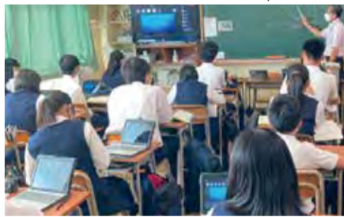
▲1人1台端末を活用した授業の様子

次に、子どもたちの健全育成についてであります。 学童保育の充実につきましては、学校内学童保育所の導入を推進し、放課後子ども教室と連携しながら事業を実施してまいります。 次に、学校教育についてであります。 学力向上につきましては、新たな取組として、1人1台端末を活用し、26市で初となる、全中学生を対象とした海外の外国人講師とのオンラインによるマンツーマン英会話レッスオンや小中学校のモデル校へのAI教材ソフトの導入により、個に応じたきめ細かな学習を実施してまいります。