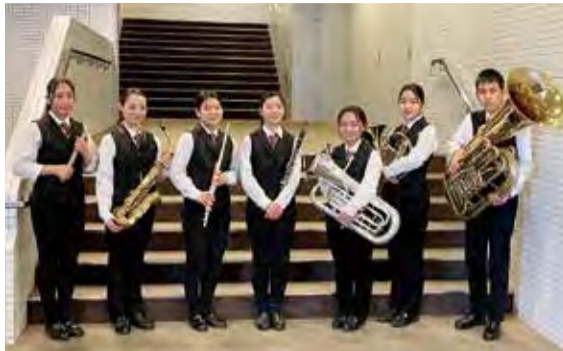
▲第一中学校吹奏楽部の出場者