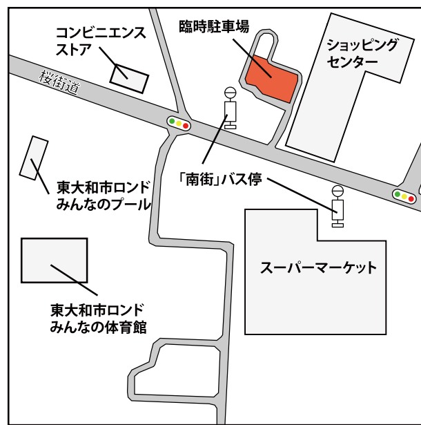
▲臨時駐車場の開設場所

都が実施する統計調査における調査票の配布・回収・調査票の審査等 ▽応募方法 所定の申請書に必要事項を記入のうえ、総務管財課（市役所3階）まで持参 ※申請書の内容を審査し、登録の可否を決定します。 ※申請書は、総務管財課または市のホームページで入手できます。 ▽問合せ 総務管財課・内線1312まで。