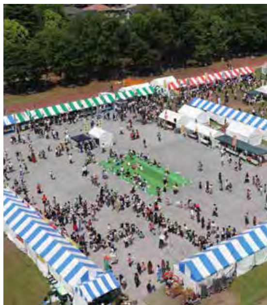
▲第8回うまかんべえ祭の様子

▽出店 会場内にPRブースとして、テント(1ブース・2.7m×3.6m)をご用意します。なお、物