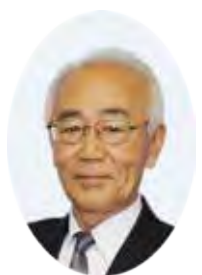
東大和市長 尾崎保夫