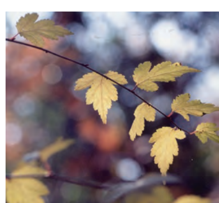
〈モミジイチゴ黄葉〉

12月。今年も残りわずか。年賀状、大掃除の準備、今年のうちにやっておくことは?と考えていると、何となく心落ち着きません。 ところで、植物もこの時期は、冬支度の真っ最中。落葉樹は葉と枝の間に、離層と呼ばれる「しきり」を作ります。しきりができる時に、葉の中でいろいろな反応が起き、赤や黄色に色づきます。紅葉や黄葉は、植物が冬支度をしている証拠といってもいいでしょう。 離層が完成すると、葉が落ちて冬越し体制に入ります。そして、葉が落ちた枝には、春に芽吹くための新しい芽がスタンバイ。春を迎える準備は万端のようです。