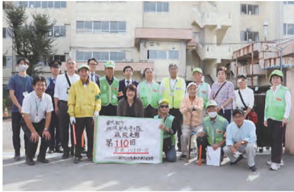
▲第110回目の安全パトロール活動前に記念撮影