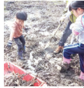
▲「スイレンを掘ろう！」のイメージ

は、市のホームページ(下の二次元コードからアクセス可)をご覧ください。 ▽対象 どなたでも(小学4年生以上推奨) ▽期日 ①スイレンを掘ろう！…12月9日(土)、12月17日(日) ②ニッ池を掘ろう！…令和