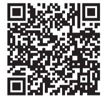
▲ひとり親世帯の方