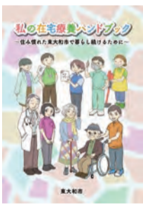
▲私の在宅療養ハンドブック