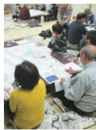
▲過去の防災モデル地区事業の様子

▽申込期限 ①12月8日(金) ②令和6年1月5日(金) ▽申込先 ①防災安全課(市役所3階)・内線1353 ②福祉推進課(市役所2階)・内線1133 ▽申込方法 各回とも次のいずれかの方法で申込み ●規定の申込用紙(防災安