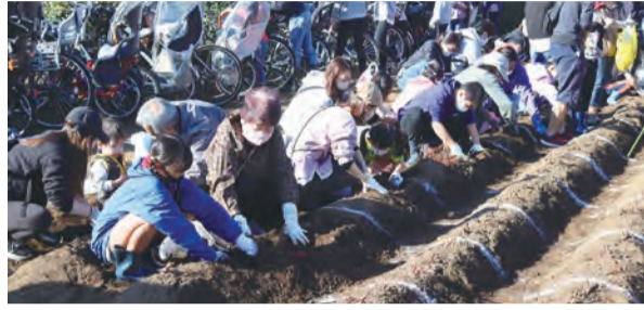
▲令和4年度のさつまいも掘り体験の様子