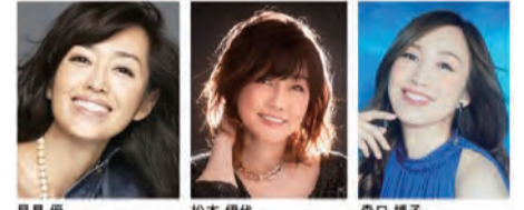
松本伊代、早見優、森口博子

令和6年2月18日(日)午後4時開演/大ホール/全席指定/前売：2,500円 当日：3,000円(宝くじの助成による特別料金です)/出演：松本伊代、早見優、森口博子/今も輝きを増し続け活躍する3人のステージをご堪能ください。懐かしいヒット曲や楽しいトークである頃のステージが蘇ります/未就学児不可