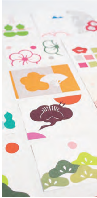
▲作成する切り絵の例

江戸の切り紙「もんきり」 伝統的な日本の文様を切り紙で作る江戸時代の「紋切り」を楽しみながら、年賀はがき、ポチ袋、箸袋、小さいついでに仕立てのカードなどを作成します。