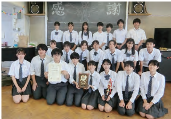
▲都立東大和高校吹奏楽部のコンクール出場者