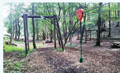
狭山緑地 フィールドアスレチックコース

23区への通勤圏内でありながら豊かな緑に囲まれた暮らしを満喫することができます。