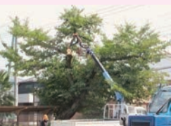
294号(11月1日発行)「第二小学校を見守る桜70年の節目」