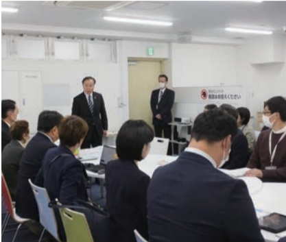
東村山市議会議員行政視察

視察内容は「高齢者見守り推進事業について」で、高齢者見守りばつぐすなぐいを案内し、施設の職員が概要等について説明しました。