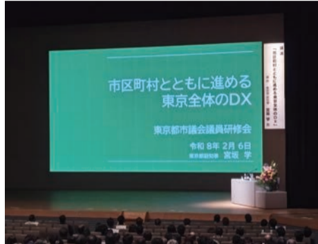
東京都議会議員研修会