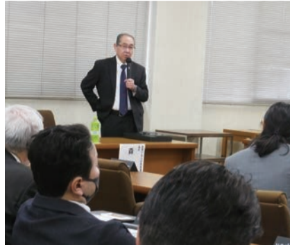
市主催議員研修会