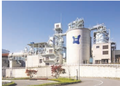
東京たま広域資源循環組合

・令和8年度東京たま広域資源循環組合一般会計予算 ・令和8年度東京たま広域資源循環組合負担金 ・監査委員(識見を有する者の選任につき同意を求めること)について ほか