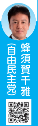
蜂須賀千雅 (自由民主党)