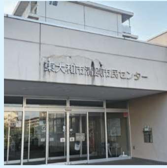
清原市民センター