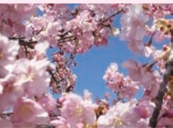
295号(2月1日発行)「青空を仰ぎ見る」

〈送付及び問い合わせ先〉 東大和市議会事務局 庶務調査係 (電話) 042-563-2111 (内線 2002) (送付先メールアドレス) gikai@city.higashiyamato.lg.jp