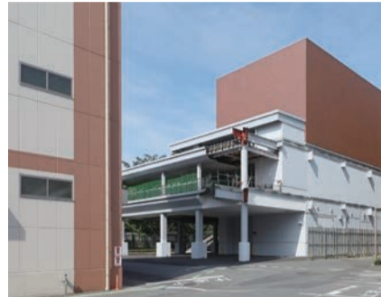
小平・村山・大和衛生組合

・令和8年度における小平・村山・大和衛生組合を組織する市の分担金額について ・令和8年度小平・村山・大和衛生組合一般会計予算 ・新ごみ処理施設建設工事請負契約の変更について