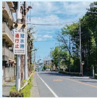
冠水被害が起きる東野火止橋付近

問 空堀川上流雨水幹線整備事業の現状と今後の取組について伺う。 答 市内のトンネル掘削が完了し、令和8年7月から約1万6千㎡の貯留施設として稼働させる。新堀地域の雨水冠水解決のため今後の取組について伺う。 問 高次脳機能障害者への周囲の理解が進み、地域で適切な支援を受けられるような取組を望む。 答 高次脳機能障害者への周囲の理解が進み、地域で適切な支援を受けられるような取組を望む。 問 東大和市の「命の授業」は小学校1年生から6年生、中学生と発達に合わせた体系的に性についてまた生命尊厳の教育を行っているが、どのように認識しているか。 答 助産師による授業を積極的に実施していることは東大和市の特徴的な取組と認識している。 要望 未来のある子供たちのために、「命の授業」を東大和市で大事に育んでいただきたい。