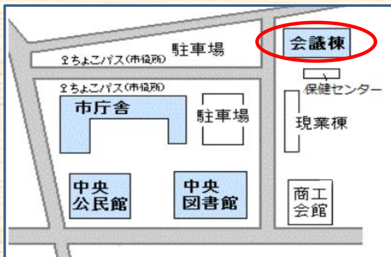
(案内図) 市役所 会議棟