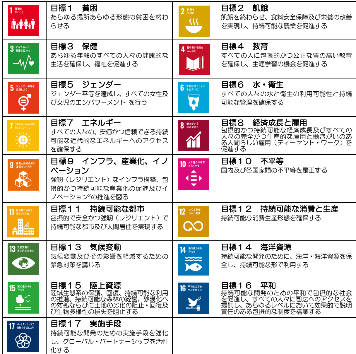
《図表 SDGsの17のゴールの内容》

SDGsは、平成27年の国連サミットで採択された国際目標です。当市では、SDGsで掲げられている17のゴールについて、地方自治体の取組と密接な関連があり、地方自治体の取組そのものが、SDGsの達成につながるものであると考えていることから、第五次基本計画で定めた施策を推進することにより、SDGsの達成に取り組んでいきます。