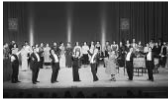
前回上演の「メリーウィドウ」から

「恋はやさし野辺の花よ」などの名曲がちりばめられた、スッペ作曲の傑作オペレッタです。公募による合唱メンバーとプロの歌手さんたちで、一緒に舞台を創りあげます。日本語で上演します。