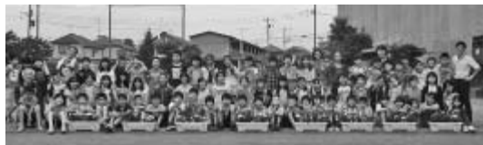
人権の花運動に参加した皆さん(上:三小、下:四小)