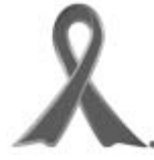
「オレンジリボン」は子どもの虐待を防止するというメッセージが込められています

少年・高齢社会により子育てや高齢者の介護が難しくなっています。過度の負担による心身の疲労や孤立化などにより、子どもと高齢者への虐待は依然として増加する傾向にあります。また、障害者への虐待についても増加が懸念されています。子育てや介護は長期にわたるため、家族だけでは限