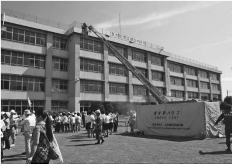
昨年の総合防災訓練の様子

発行/東大和市 編集/企画財政部秘書広報課 (〒207-8585) 東大和市中央3-930 ☎042-563-2111(市役所代表) ファクス042-563-5932