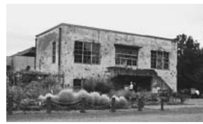
旧日立航空機(株)変電所

この変電所は、旧日立航空機(株)立川工場で使用されていたもので、建物の壁面には戦時中、米軍の大規模な攻撃による機銃掃射や爆弾の破片によってできた無数の穴が残っています。