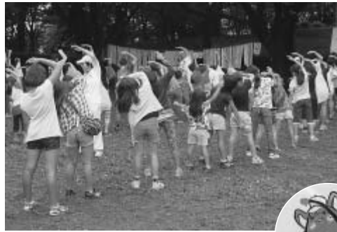
市教育委員会の公式キャラクター「やまとっくん」

6月28日から7月7日までの間、都立東大和南公園で七夕飾りが展示されました。これは都立公園が開催した七夕イベントで、第二小学校の児童達や来園した子ども達が笹に短冊などの飾りつけをして、展示したものです。高さ5メートルにもなる、色とりどりの七夕飾りの短冊には、「大きくなったらサッカー選手になりたい」「友達がたくさんできますように」などたくさんの願い事が飾られていました。