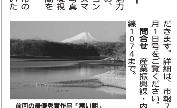
前回の最優秀賞作品「寒い朝」