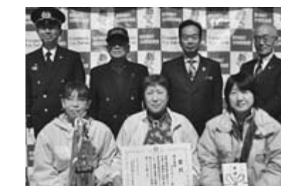
総合優勝 青少年チーム（写真下段）

をかけることとなりますので、十分な管理をお願いします。農地を農地以外の目的に利用（転用）するには、農地転用の届け出が必要ですが、また、農地は国や東京都が借りるなど法律に定めのある場合を除き、許可を受けないと貸し借りはできませんので、事前にお問い合わせください／お近くの農業委員または農業委員会事務局・内線1072まで。 体育施設利用料金減額・免除に該当する団体は申請をお願いします 体育施設利用料金の減額及び免除に該当する団体は、社会教育関係団体として承認が必要です。希望する団体は、市内在住・在勤の方で組織され、市内在住者が半数を超えている団体（子ども料金対象団体及び東大和市体育協会加盟団体は申請の必要はありません）のうち活動が広く市民に開放されている団体です／ 提出書類 社会教育関係団体承認申請書、団体規約、構成員名簿、平成25年度事業実績書及び収支決算書、平成