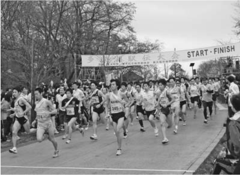
昨年開催された第23回多摩湖駅伝大会の様子

発行/東大和市 編集/企画財政部秘書広報課 (〒207-8585) 東大和市中央3-930 ☎042-563-2111(市役所代表) ファクス042-563-5932