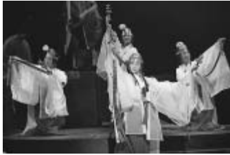
▲わらび座公演「小野小町」から

6月15日(日)午後3時開演 / 大ホール 全席指定 / 4,500円(友の会4,000円) / 脚本 内館牧子 / 演出 栗城宏 / 4月12日(土)からチケットの発売を開始します / 連動企画として、ワークショップの開催を予定しています。詳細は、お問い合わせください。