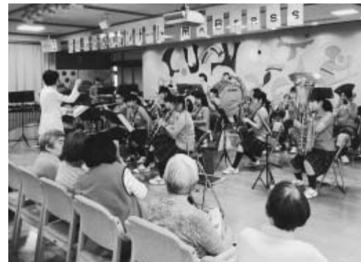
▲全6曲とアンコールを含め、約1時間の演奏を行った都立東大和南高校の吹奏楽部の皆さん

6月21日、さくら苑で6回目となる地域ふれあいコンサートが開催され、都立東大和南高校の吹奏楽部による演奏会が行われました。当日は、さくら苑に入所されている方やご家族など約70人の方が、高校生の元気溢れる演奏を間近で楽しみました。来場者の中には、「ふるさと」や「見上げてごらん夜の星を」などの懐かしい曲が演奏されると、素晴らしい演奏に涙を流し、聴き入っている方もみられました。