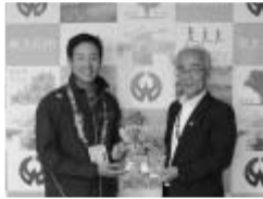
※デフリンピックとは、聴覚障害者のためのオリンピックです。