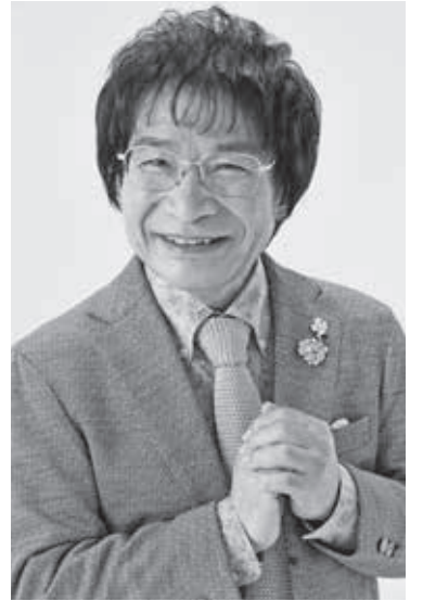
▲テレビでも大人気の「尾木ママ」こと尾木直樹氏の講演会があります。