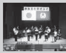
▲昨年度の閉会式の様子