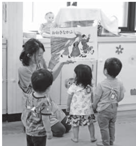
▲「0歳児親子あつまれ!」で行われた読み聞かせの様子。

■0歳児親子あつまれ! 子ども家庭支援センター「かるがも」では、0歳児親子を対象に、情報交換や、友達づくりをする場所を提供します。ぜひ遊びに来てください。 ▽対象 東大和市在住で、参加当日に0歳のお子さんとその保護者 ▽日時 10月18日(水) ①午前10時〜11時 ②午後2時〜3時 ※ご都合のよい方の時間にお申し込みください。 ▽場所 子ども家庭支援センター ▽申込み 10月2日(月)午前10時〜17日(火)午後5時までに子ども家庭支援センターの事務室もしくは電話でお申し込みください。 ■子ども家庭支援センター 休館日のお知らせ 11月9日(木)は、ハミングホールで、かるがもまつり、