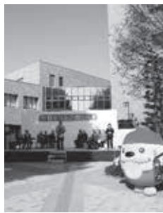
▲昨年の東やまと産業まつりの様子