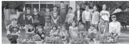
▲人権の花運動に参加した皆さん (上の写真は第九小学校、下の写真は第十小学校)