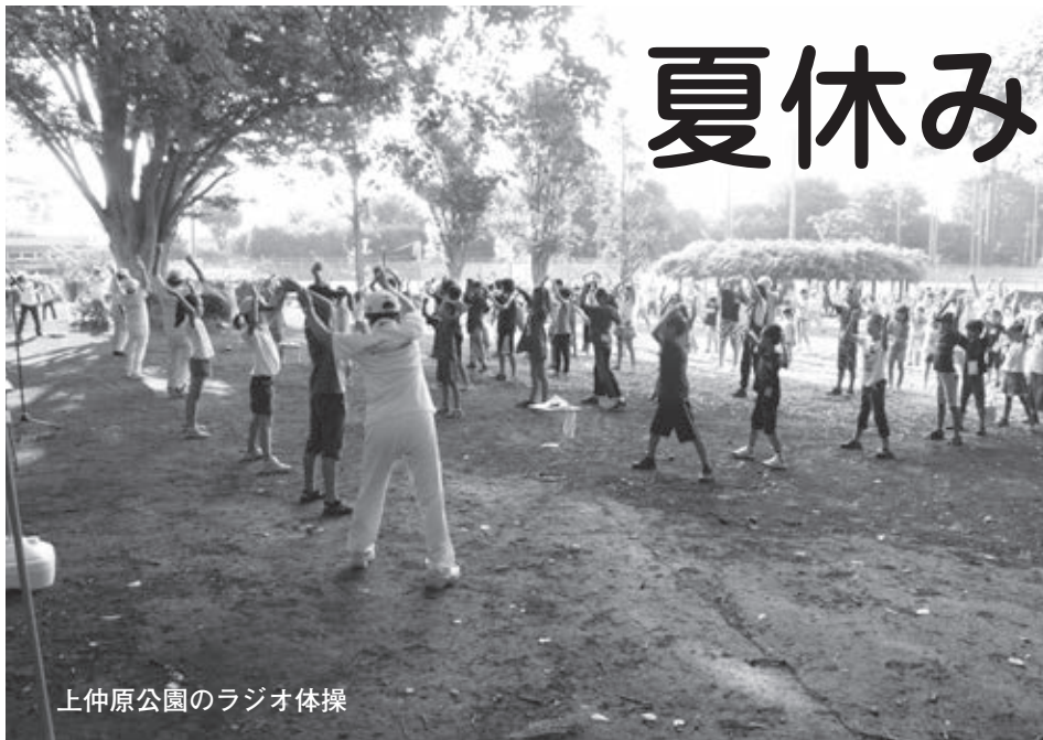
上仲原公園のラジオ体操