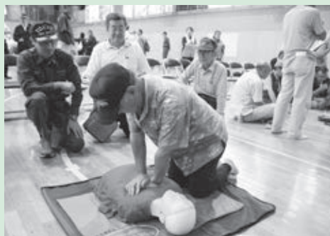
▲昨年の総合防災訓練の様子(第一中学校体育館)

①市民の方が参加できる訓練：初期消火、救出・救助、応急救護、避難所体験、マンホールトイレの取扱、応急給水キットの使用、煙体験、炊き出し ②展示・体験：警察・消防・自衛隊等の車両展示、制服着用体験、備蓄食料試食等