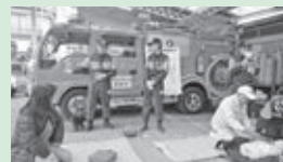
▲高木自治会で行われた防災訓練の様子(応急救護訓練)