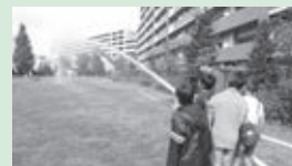
▲東京ユニオンガーデンで行われた防災訓練の様子(放水訓練)