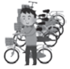
自転車は駐輪場へ

市では、武蔵大和駅前周辺の市が運営している無料の駐輪場を10月1日(日)から有料化します。有料化する駐輪場のうち、武蔵大和駅前第1、2公共自転車等駐輪場は、ホームページかはがきで事前申込みすること、定期利用ができます。