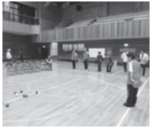
▲ボッチャの競技風景

ニュースポーツの普及と、幅広い世代の方がスポーツを通じて健康増進と相互交流を深めることを目的に、スポーツ推進委員事業として「ニュースポーツで遊ぼう!」を実施します。 小学生以上であればどこでも参加できます。ぜひ、遊びに来てください。 ▽参加資格 市内在住・在学の小学生以上の方 ▽日時 9月2日(土)午後1時30分〜3時50分(受付は