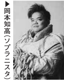
▶岡本知高(ソプラニスタ)