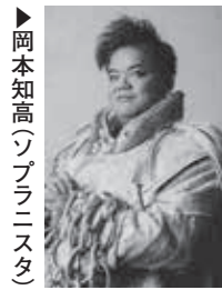
▶岡本知高(ソプラニスタ)

7月22日(土)午後3時開演／大ホール 全席指定／一般6,000円(友の会5,500円)、3歳以上は有料。3歳未満ひざ上鑑賞は無料、座席が必要な場合は有料。