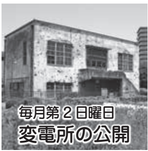
毎月第2日曜日 変電所の公開