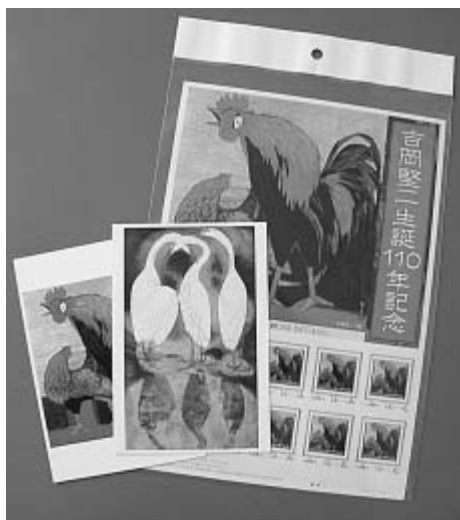
▲52円切手10枚とポストカード2枚のセットで930円です。絵柄は吉岡堅二の作品「暁」。ぜひお買い求めください。

調査の対象となった方には、調査票(アンケート用紙)を2月15日(水)に郵送しますので、ご協力をお願いします。 対象者 2月1日現在、東大和市にお住まいの18歳以上の方(無)・〇〇〇人(無)として抽出。 回答方法 記入済みの調査票を返信用封筒で郵送(投函)してください。 回答期限 3月15日(水) 問合せ 企画課・内線1425まで。