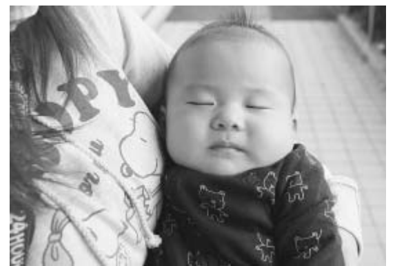
子どもを、感染症から守るために…

予防接種の予診票発行には、母子健康手帳を確認するため、窓口で手続きをする必要があります。母子健康手帳を持参し、市立保健センターまでお越しください。