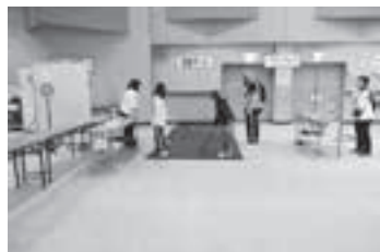
▲ニューススポーツ体験コーナー