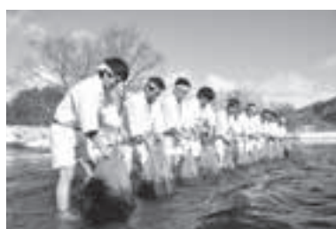
▲そばの実を川で晒す「寒晒し」の様子

寒晒しそばは、江戸時代、徳川将軍家に献上されていたという記録が残る贅沢なそばです。その幻の技法を用いた寒晒しそば(さらしな、あらびき、田舎そば)を、食べてみませんか。 ▼日時 3月17日(土)・18日(日)午前10時～午後3時(入場は午後2時まで) ▼場所 喜多方市山都体育館(山都総合支所前) ▼料金 チケット制(要予約) ●そば4種類と料理 一、五〇〇円