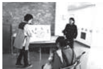
▲大型絵本読み聞かせ教室