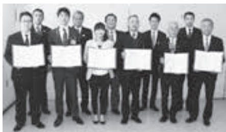
▲新たに協力機関となった事業者等の皆さん

このネットワークは、地域で活動する事業所等の協力機関が高齢者を見守るために作られたものです。協力機関が日常業務の中で、