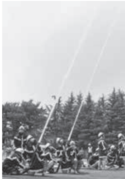
▲消防演技をぜひご覧ください。

仕事をするには、緩和型訪問サービスの事業所に所属していただくこととなります。 ▽対象 緩和型訪問サービスへの従事を希望する方 ▽日時 1月23日(火)・24日(水)午前9時30分～午後4時 ▽場所 市役所会議棟第10会議室 ▽内容 業務に関する基本法令、接遇・コミュニケーション技術、高齢者の特性、求められる役割、対象者に合わせた生活援助、市内介護保険サービス事業所について等 ▽定員 20人 ▽申込み 1月15日(月)までに高齢介護課(市役所2階)・内線1179まで。