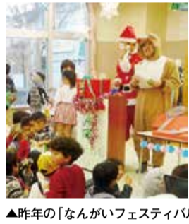
▲昨年の「なんがいでフェスティバル」

◎東京都大気汚染医療制度 一定の要件を満たす方に対して、認定された疾病の治療に要した医療費のうち、保険適用後の自己負担額を助成します。 対象 次の①〜⑤の要件を全て満たす方 ①18歳未満(18歳以上の方の新規申請の受付は行っていません) ②気管支ぜん息・慢性気管支炎・ぜん息性気管支炎・肺炎しゅ(これらの続発性を含む)に罹患している ③都内に引き続き1年(3歳未満は6か月)以上住所を有する(都内住民登録が必要) ④健康保険等に加入している ⑤喫煙していない ◆以上の問合せは、手続きについては市立保健センター ☎042-565-5211、制度については東京都福祉保健局環境保健衛生課 ☎03-5320-4491へ。