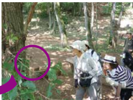
▲オオムラサキを見る隊員の皆さん