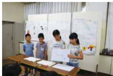
▲観賞会での発表の様子

このホタルの飼育は、七小ホタル保存会の皆さんにボランティアとして協力していただいています。地域に支えられ、今年で22年目を迎えたホタルの光です。