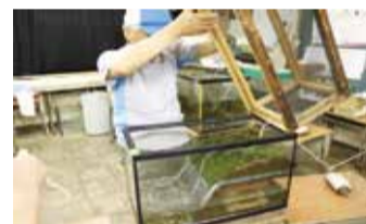
▲ホタルの幼虫は、春に水辺から陸へ上がって土の中にもぐり、その後さなぎとなります。上の写真はそのため装置(水槽)です。

このゲージは、普段からホタルの飼育で使用している環境学習室に設置されました。窓がカーテンで閉じられると、教室は暗闇となり、ゲージの中では約200匹のホタルが発光。子どもたちはもちろん、多くの見学者たちが美しい光に見入っていました。