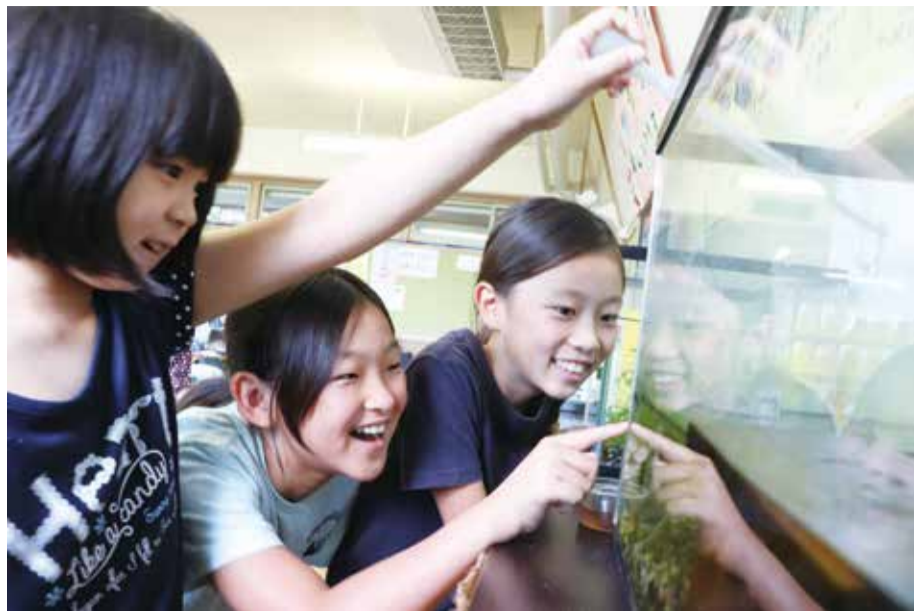
▲教室にある水槽で、トウキョウサンショウウオを育てました