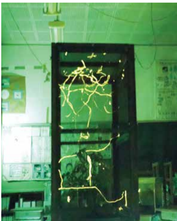
▲ゲージの中で発光するホタル

このゲージは、普段からホタルの飼育で使用している環境学習室に設置されました。窓がカーテンで閉じられると、教室は暗闇となり、ゲージの中では約200匹のホタルが発光。子どもたちはもちろん、多くの見学者たちが美しい光に見入っていました。