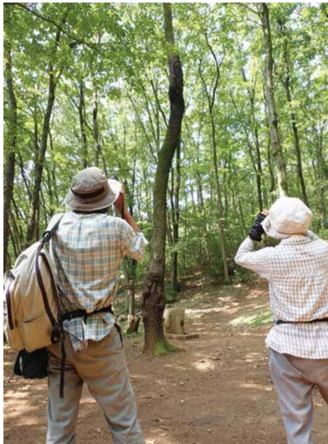
▲オオムラサキを探す隊員の皆さん