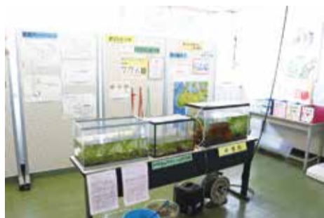
▲学校内のトウキョウサンショウウオのコーナー

子どもたちは6月21日に、生息地である狭山丘陵に出かけ、計30匹のトウキョウサンショウウオを放流しました。狭山丘陵の泉で、トウキョウサンショウウオをたくさん見られる日が来ることを願って…。